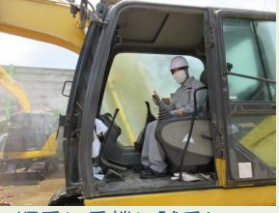
順番に重機に試乗して 楽しそうな様子でした。