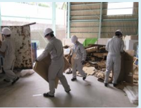
新築現場から出た廃棄物 の分別作業の体験です。