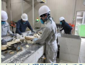
いよいよ選別プラントでの 体験スタート。