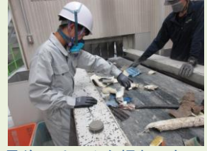
最後にはみんな慣れてきて 立派に選別が出来ていました。