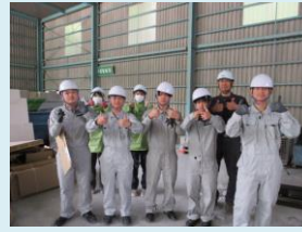
記念撮影。みんなとても 良い笑顔です！