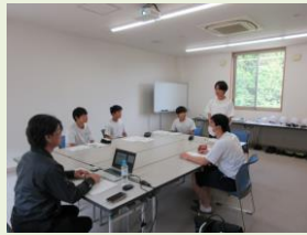
自己紹介をしてスタート。 産廃についても学習します。