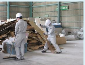
最後はきれいに掃除も します。