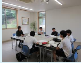
2日間の体験について 話をしました。