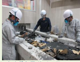
木くずを見分けて取って いきます。