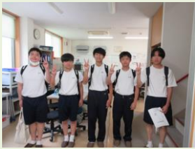
「よろしくお願いします。」 元気なあいさつです。