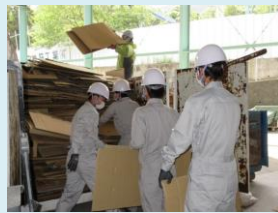
ダンボールがたくさんあった ので一生懸命に積込みました。