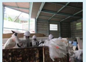
運ぶ姿も様になってきました。