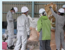
廃棄物を計量します。