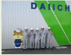
作業着に着替えてイチー と記念撮影。