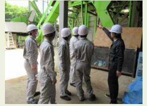
場内を色々見学。 みんな熱心です。