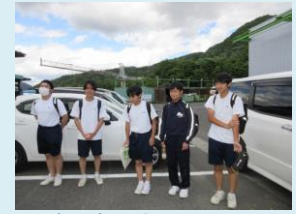
最後にあいさつ。 「ありがとうございました。」